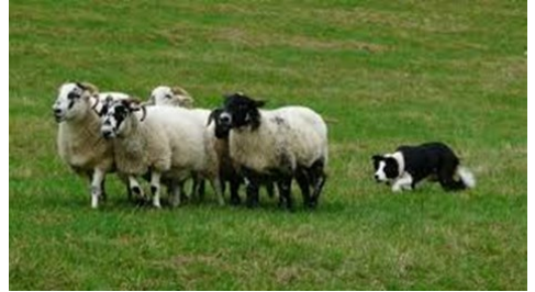
Ci-dessus, le troupeau est calmement déplacé par un border collie

Même s'il existe aujourd'hui une variété importante de chien de type berger et bouvier, il est question ici de s'attarder sur le chien dit « de troupeau ». Bien que le chien de protection du troupeau existe probablement depuis les débuts de l'élevage de moutons, le chien de conduite n'est apparu que bien plus