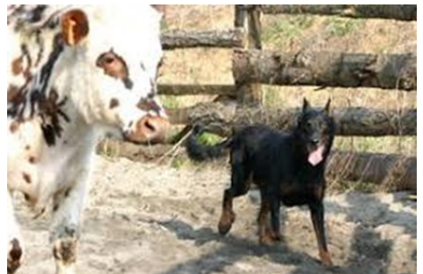
Ci-dessus, un beauceron au travail sur bovins

Le chien de rive est traditionnellement utilisé dans les transhumances de grands troupeaux, navigant principalement sur les côtés du troupeau pour empêcher celui-ci d'empiéter sur des cultures annexes. Il est également capable de protéger le troupeau des prédateurs grâce à l'utilisation fréquente de la voix, au contraire des chiens de conduite qui travaillent en silence. Le rabattage n'est pas forcément son point fort, mais avec un peu d'entraînement il en est parfaitement capable. Le trot est l'allure de prédilection du chien de rive, doté d'une grande endurance. Souvent plus à l'aise à proximité qu'à distance du troupeau, ce sont d'excellents chiens d'enclos et