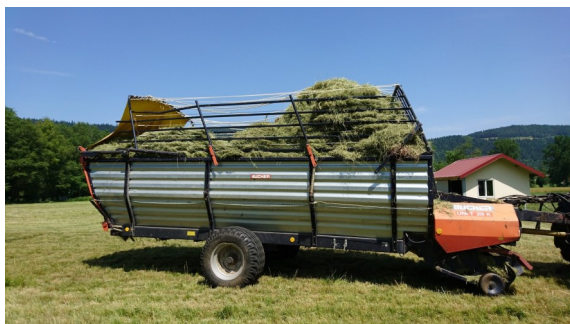
Le chargement terminé

Ramassage terminé à 12h30. Un immense merci à toute l'équipe ! Vivement la pluie qui arrosera notre terrain et permettra une jolie tonte avec des couteaux bien aiguisés.