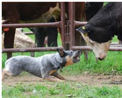
Ci-dessus, un bouvier australien en pleine confrontation

La Suisse compte un nombre important de race bouvier, tels que le bouvier appenzellois, le bouvier de l'Entlebuch ou encore le bouvier bernois. Le chien de bouvier travaille sur de grands troupeaux bovins, assurant le déplacement entre les terrains, utilisant facilement le coup de dent et le pincement pour se faire respecter, de même que la voix. Ceci explique certainement la fréquence des morsures de ce type de chiens sur des humains et leur tendance à être « aboyeur », d'autant plus si leur génétique est orientée travail au troupeau et leur quotidien celui d'un chien de compagnie. Toutefois, au sein d'une exploitation, que ce soit en pâture ou à l'écurie, ils représentent