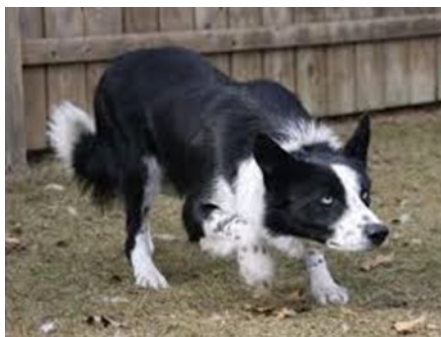
Ci-dessus, belle attitude typique de l'œil chez un border collie