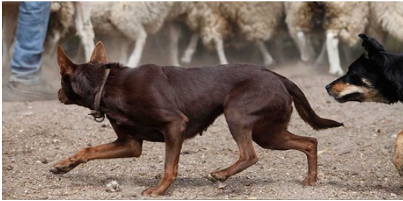
Ci-dessus, deux working kelpies en action

La capacité à travailler à distance du troupeau, l'écoute, la prise d'initiative mais surtout le naturel génétique sont des qualités très recherchées. En utilisant l'œil (voir chapitre « l'œil, un super pouvoir ») et sa posture corporelle caractéristique d'immobilisation et de fixation du troupeau, ils s'imposent naturellement sur le bétail, même à distance, bien qu'une mise à l'ordre frontale s'avère parfois nécessaire.