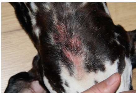
Exemple d'un Hot Spot sur le crâne d'un chien

La lésion est généralement isolée, mais plusieurs lésions peuvent se développer en même temps. Elles se situent typiquement sur le tronc, la base de la queue, la face externe des cuisses, le cou et la joue.