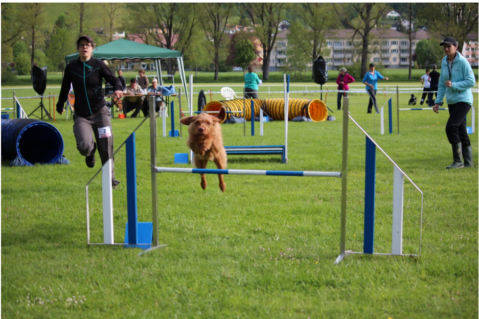
Ezra et Candice en concours agility

J'ai débuté mon parcours cynologique avec ma première chienne Ezra, Braque Hongrois à poil dur, qui était destinée au départ à chasser avec mon mari. Mais étant donné que je désirais que mon chien ait quelques bases d'éducation, j'ai débuté les cours au club et j'ai découvert le monde de la cynologie qui m'a immédiatement passionné. J'ai beaucoup travaillé avec Ezra et une complicité s'est créée, je n'étais pas tranquille quand elle partait à la chasse avec mon mari et comme je travaillais beaucoup pour qu'elle soit très focus sur moi, elle ne prenait pas beaucoup d'initiative pour partir au gibier, de ce fait Ezra est restée avec moi et nous avons mis la chasse de côté.